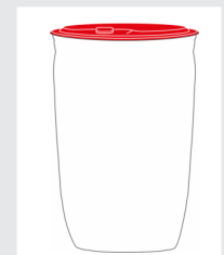
Fass 120 kg Art.-Nr.: 2005130