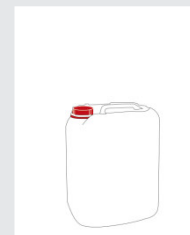
Kanister 10 l Art.-Nr.: 2000028