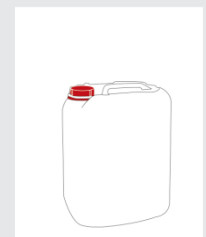
Kanister 25 kg Art.-Nr.: 2000916